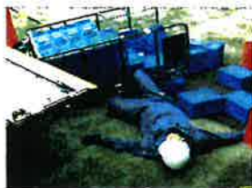
荷台からの転落災害