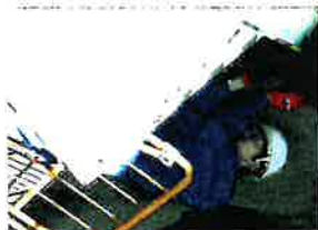
荷の転落による災害