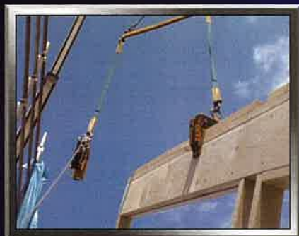
玉掛け不良により吊り金具が外れる

気の緩み、慣れから来る決断が、その後どんな代償として、誰に、どれだけ降り掛かるのか？ 建築現場で起きる災害をリアルに描くドラマ部分に加えその責任と代償の鋭い解説を盛り込み、より安全への意識を高め、根付かせる作品となっています。